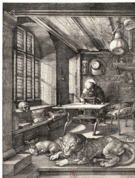
Albrecht Dürer, Saint Jérôme dans son étude , burin, 24,6 x 18,7 cm, 1514.

À quoi sert une liste de graveurs célèbres et morts ? L'auteur nous l'explique très bien : « L'histoire d'un art est celle des artistes qui l'ont professé. C'est aussi leurs ouvrages qui peuvent donner les meilleures