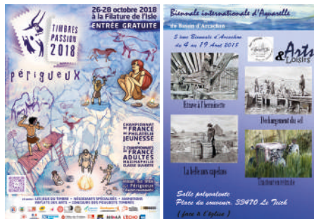
P. Bara, affiche de Timbres Passion 2018, Périgueux (© P. Bara) ; J. Lemaire, affiche de la biennale internationale d'aquarelle, Le Teich (© J. Lemaire)