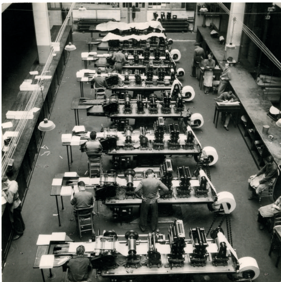
Atelier des timbres-poste, Paris, boulevard Brune, années 1950-1960.