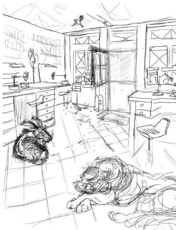
1 - Croquis de cadrage dans l'atelier.

dans un bureau de poste, nous place face à une machine pour obtenir une vignette à chiffres. À l'époque de l'explosion du courrier, on comprend parfaitement cette volonté de faciliter le quotidien des administrations, des entreprises, des ensevelis sous les paperasses en leur faisant gagner du temps par un systématisme ultra-fonctionnel dépouillé à l'extrême. Mais aujourd'hui, à l'époque d'internet, des mails, des portables, des virements bancaires, cette logique quantitative n'a plus aucune réalité. Absolument partout autour de nous les images règnent, nous sommes pétris de visuels, et pourtant les quelques lettres que l'on reçoit encore sont