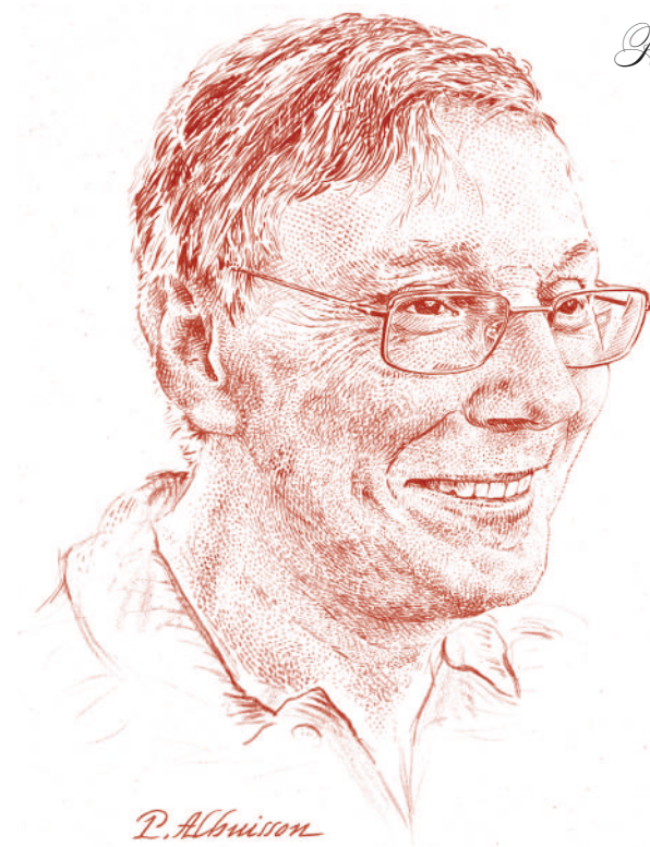
Portrait de Pascal Rabier, dessin à la sanguine, 2017 © ATG/P. Albuissou