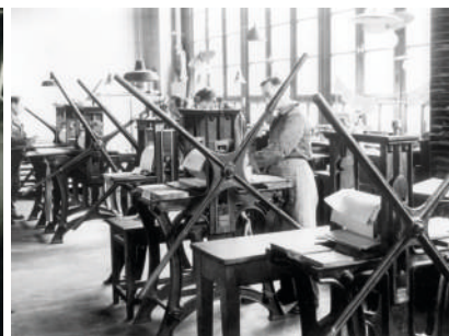
I.T.P., l'atelier des presses à bras 1950