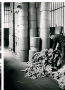
Chiffons d'essuyage