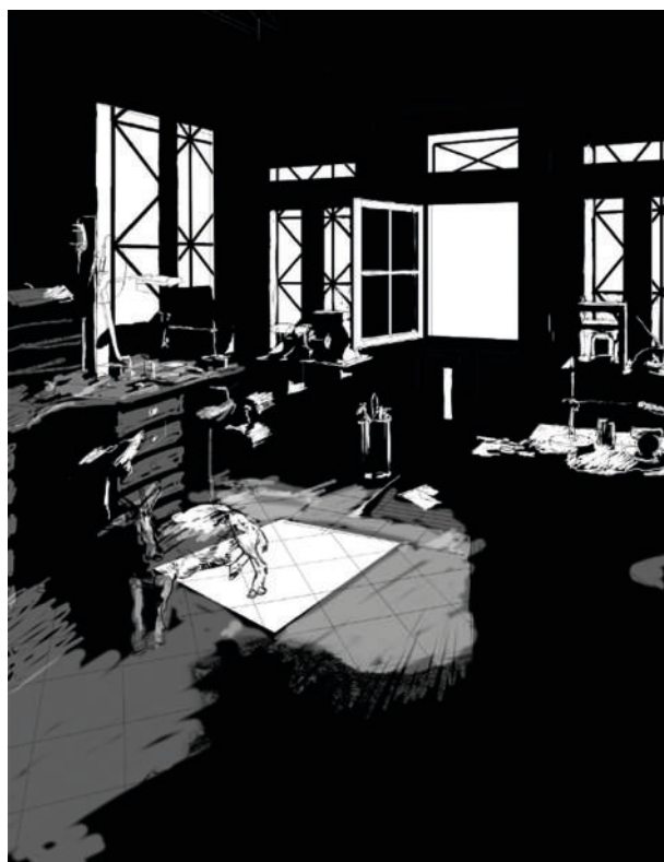
3- Recherche de la lumière.