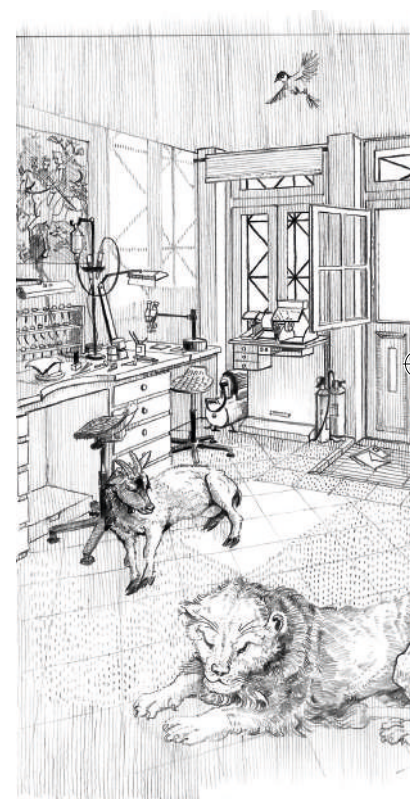
2 - Contours, évocation des trames au crayon.

Sarah Bougault, esquisses pour la gravure de l'ATG, Transmission .