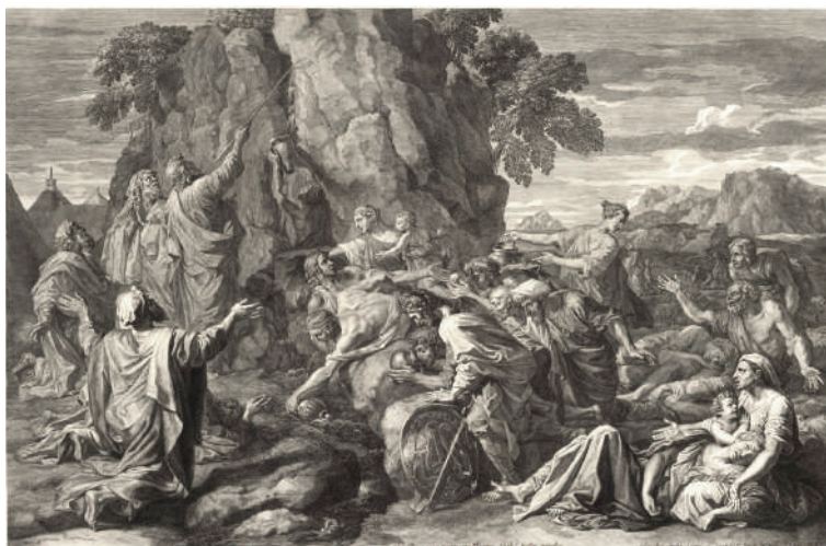
Claudine Bouzonnet Stella, Moïse fait jaillir l'eau du rocher , gravure d'après le tableau de Nicolas Poussin, 1687.

Ce sujet posait déjà des problèmes pratiques en 1830 à A. M. Perrot qui, dans son Manuel du graveur ou traité complet de l'art de la gravure en tous genres , cite 3 femmes parmi la liste des 170 graveurs les plus célèbres et fait preuve d'ingéniosité pour les inclure dans le métier :