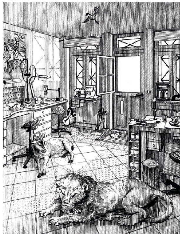
4 - Évocation des trames croisées au crayon, renforcement des ombres.

suis passée par la pratique de la gravure numérique. Il faut œuvrer avec une machine en tenant compte de tout ce qu'elle ne peut pas faire mais sans renoncer à l'intention initiale. J'ai pratiqué ces acrobaties numériques jusqu'à l'épuisement. La machine a un potentiel indiscutable mais il est inévitablement linéaire et circonscrit. D'une certaine manière, elle contraint la pensée, et vous oblige à des détours inouïables pour atteindre votre but. J'ai un exemple assez merveilleux pour illustrer mon propos. Dans le cadre d'un projet d'accessibilité confié à l'entreprise dont je faisais partie,