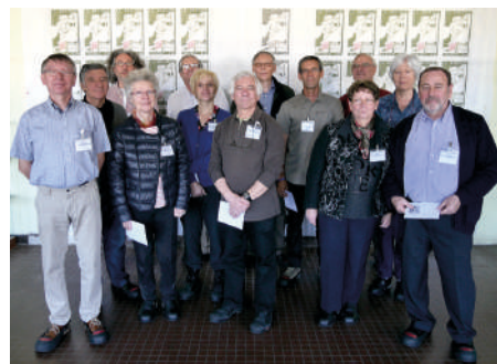
Groupe de l'ATG en visite à Phil@poste Boulazac le 17 oct. 2017.

En 2017, l'ATG a organisé en collaboration avec Phil@poste Boulazac, deux visites de l'imprimerie des timbres-poste, chacune d'une quinzaine de personnes. En fonction de l'agenda de l'imprimerie, d'autres visites collectives seront prévues au cours du 2ème semestre 2018. Les modalités d'accès sont précisées dans l'espace adhérent du site Internet de l'association. L'agenda y sera communiqué.