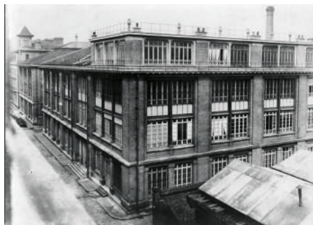
Vue du bâtiment, vers 1950.

L'histoire de l'imprimerie des timbres-poste remonte à 1848, date du décret-loi annonçant l'émission des premiers timbres-poste français, le 1er janvier 1849. L'administration des Postes doit à ce moment-là organiser un nouveau service et créer un atelier. La fabrication des timbres-poste est alors placée sous le contrôle de la Commission des Monnaies et Médailles dépendant du ministère des Finances. Les ateliers sont aménagés à l'Hôtel des Monnaies.