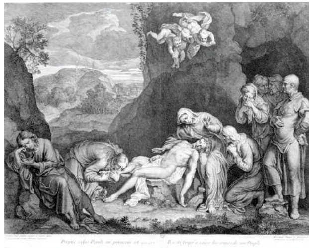
Élisabeth Chéron, Descente de croix , gravure d'après le tableau de Gaetano Giulio Zumbo, XVII e , gravure. Paris, BnF, dép. des Estampes et de la photographie.