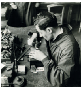
La création d'un timbre